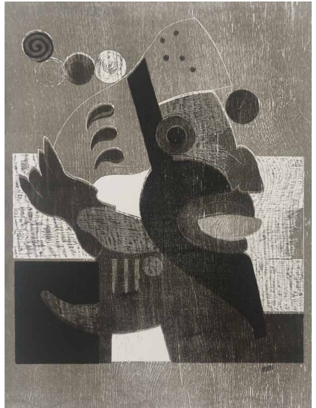
Aztekisk krigare, träsnitt, 1990-tal, 80 x 60 cm