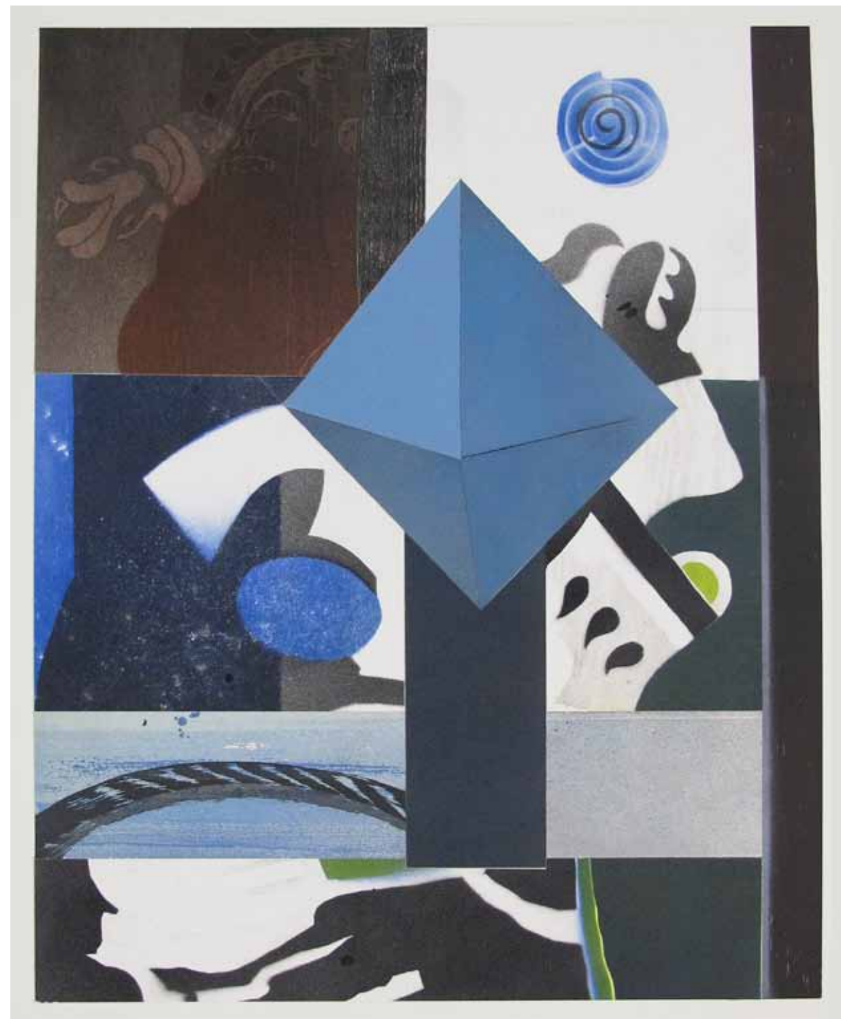
Vind, grafiskt collage, 2016, 80 x 60 cm