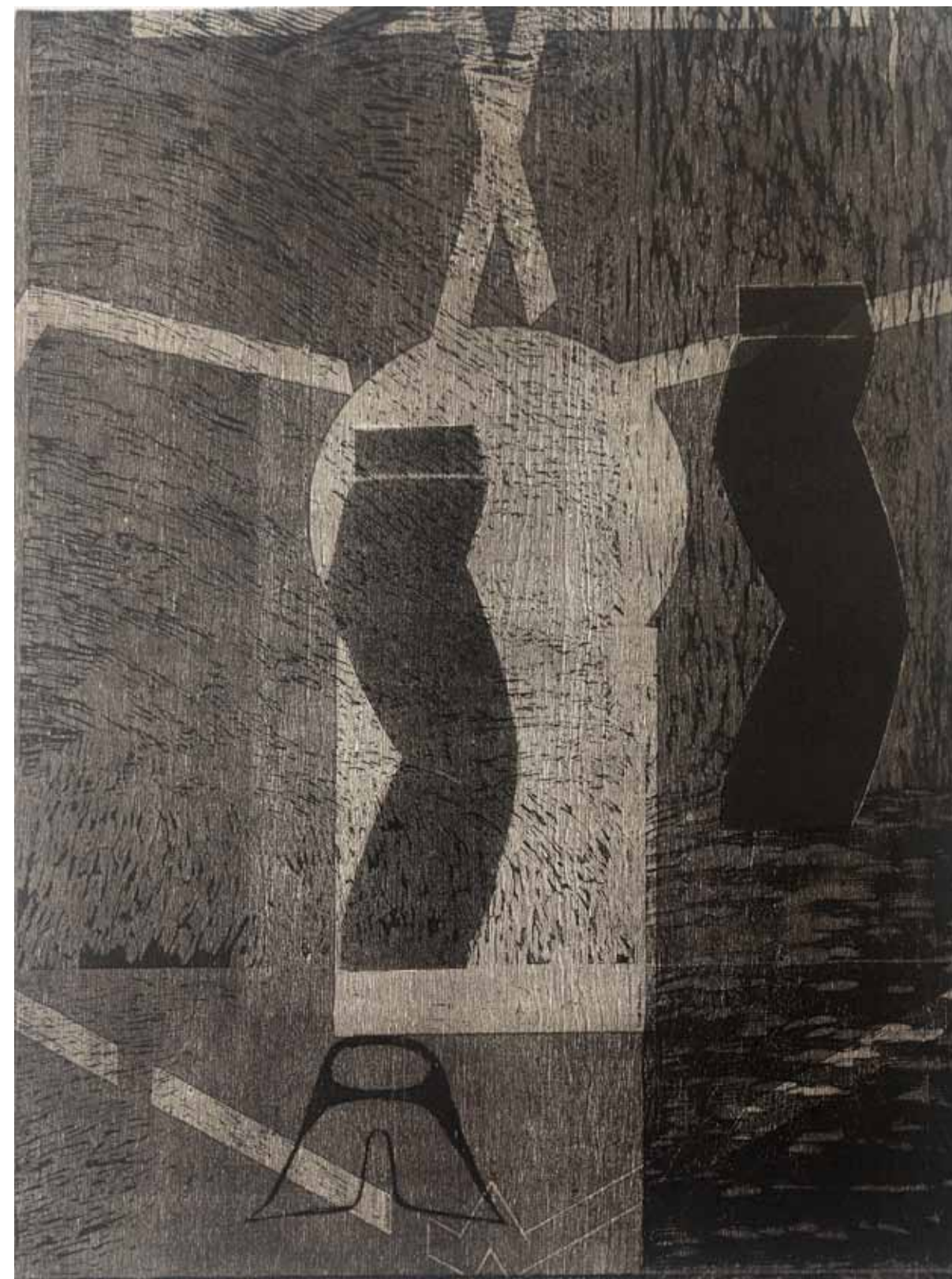
Alhambrasviten III, träsnitt, 2002-03, 80 x 60 cm