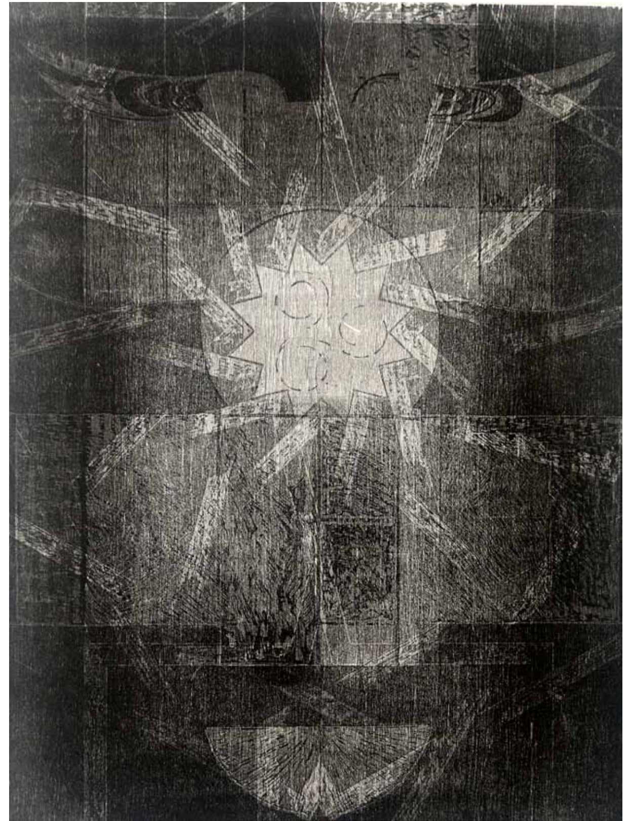
Alhambrasviten I, träsnitt, 2002-03, 80 x 60 cm

Den här sviten visas för första gången i sin helhet på Berndts utställning på Skövde konstmuseum i samband med releasen av den här boken i februari 2022