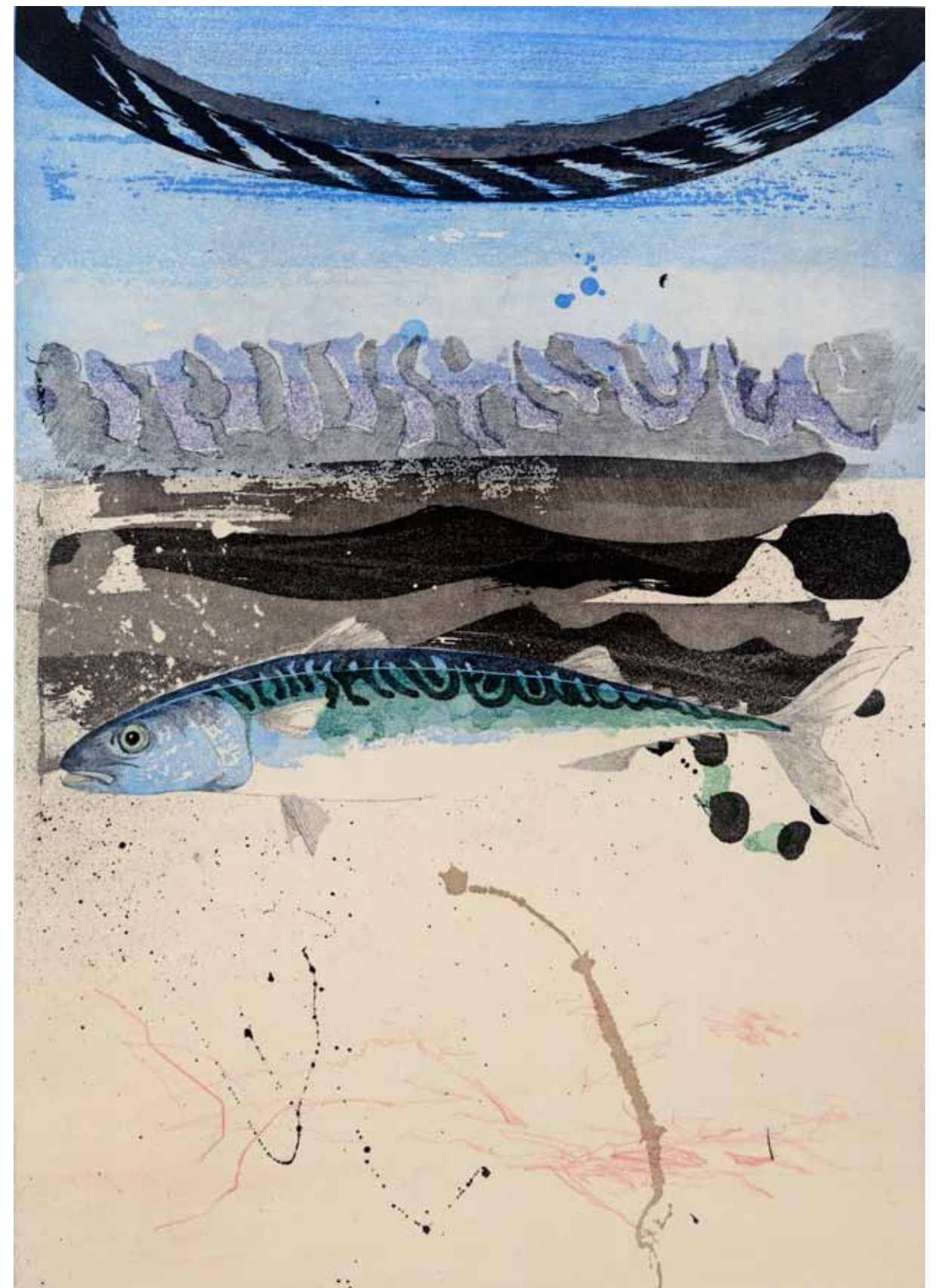
Makrill, etsning, 1986, 50 x 35 cm