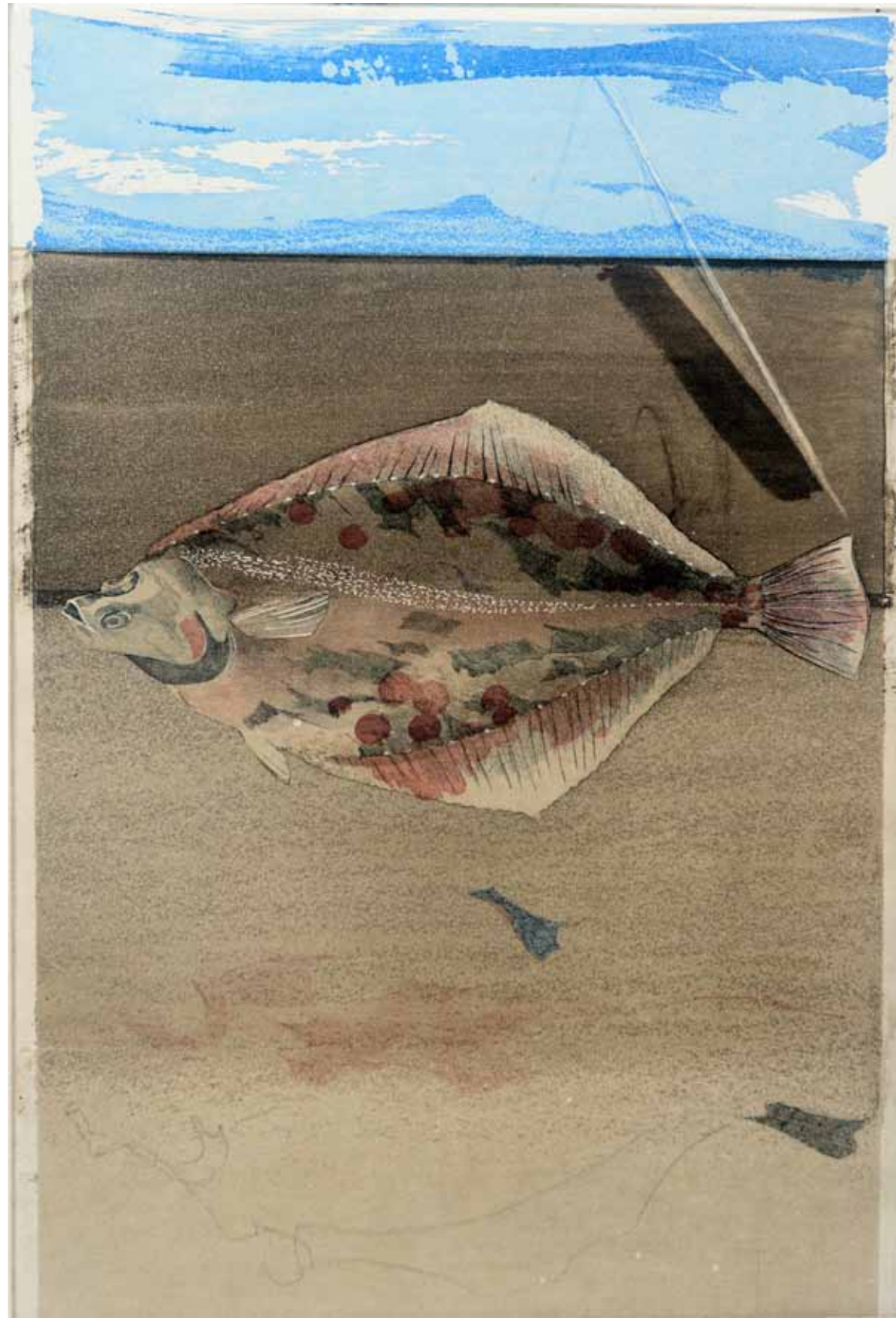
Spätta, etsning, 1985, 49 x 33 cm