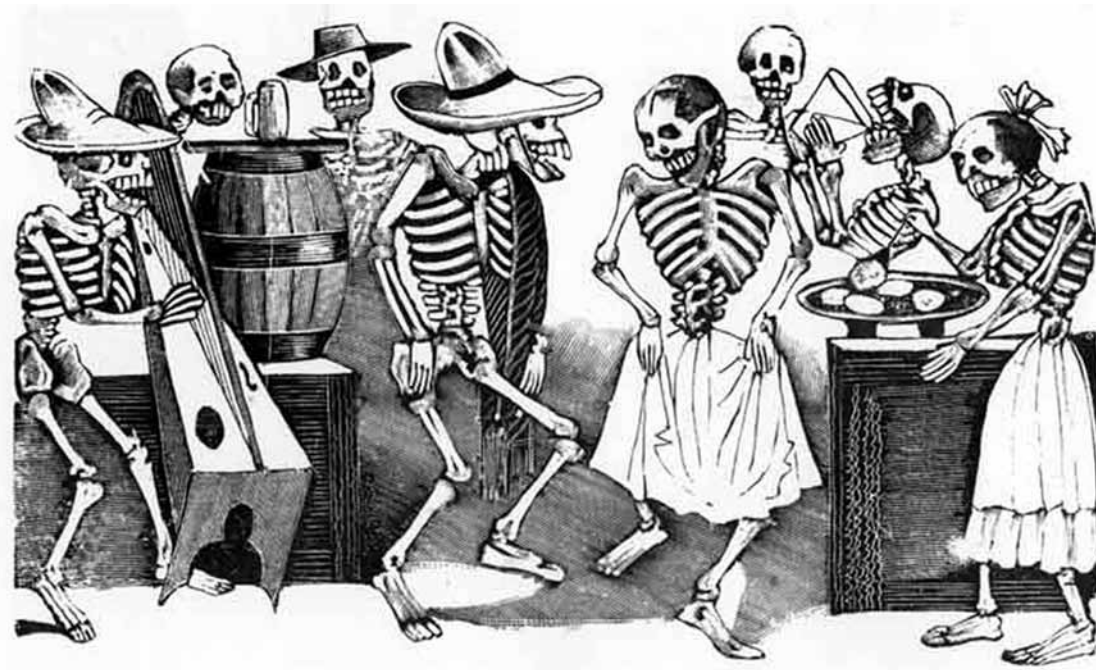
José Guadalupe Posada (1851 – 1913)

Mexikoresan gav många avtryck i Berndts konst. Han tog intryck av Posadas sätt att jobba med bilder och framför allt av de både till form och innehåll starkaste bilderna, flera med döden som motiv.