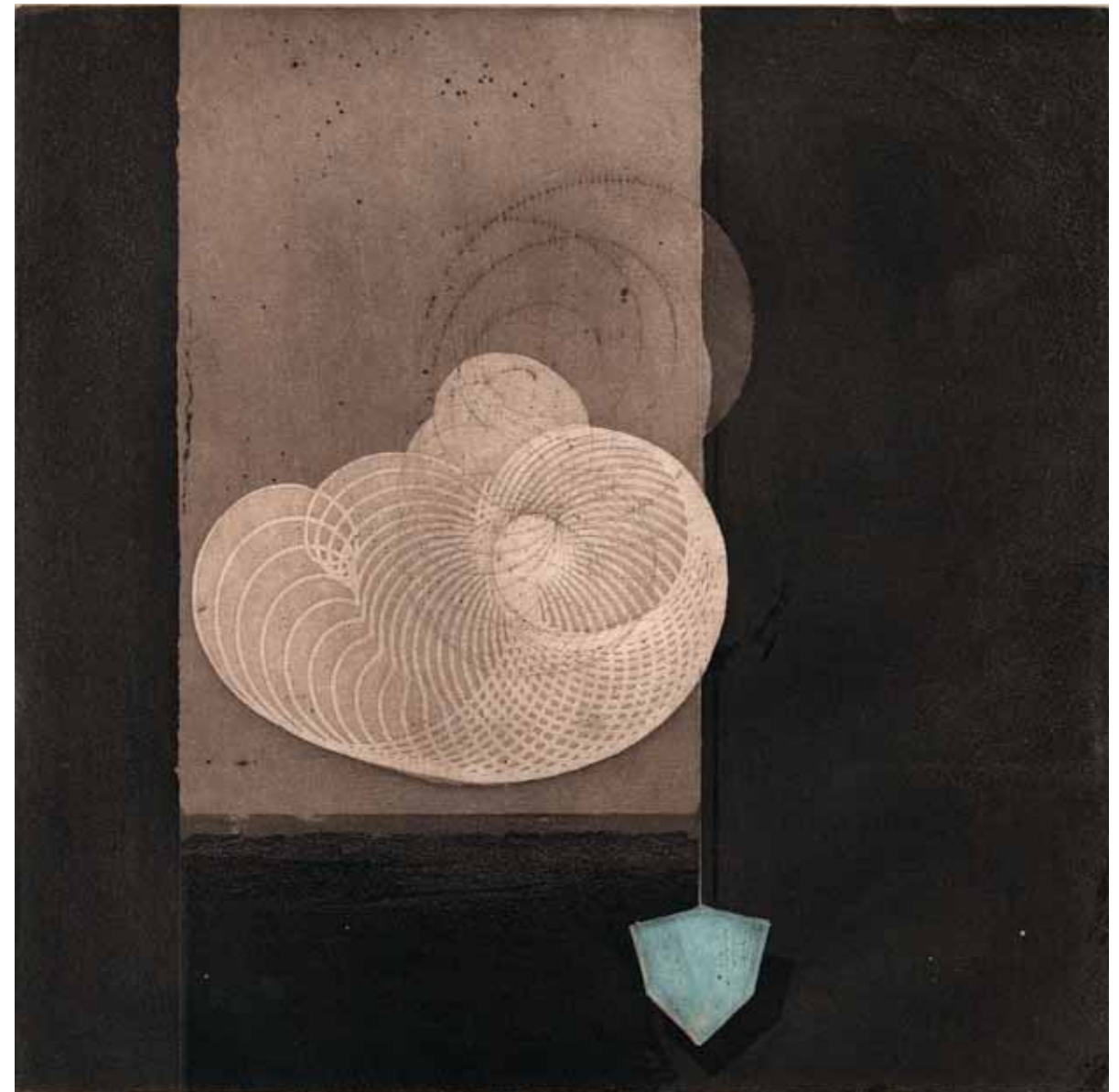
Det svänger III, etsning, 2007, 24 x 24 cm