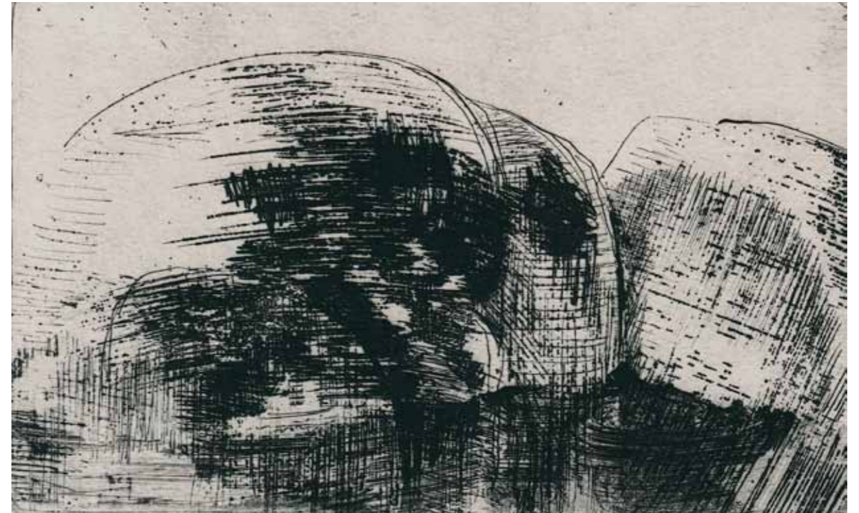
Kust, etsning, 1963, 13 x 21 cm