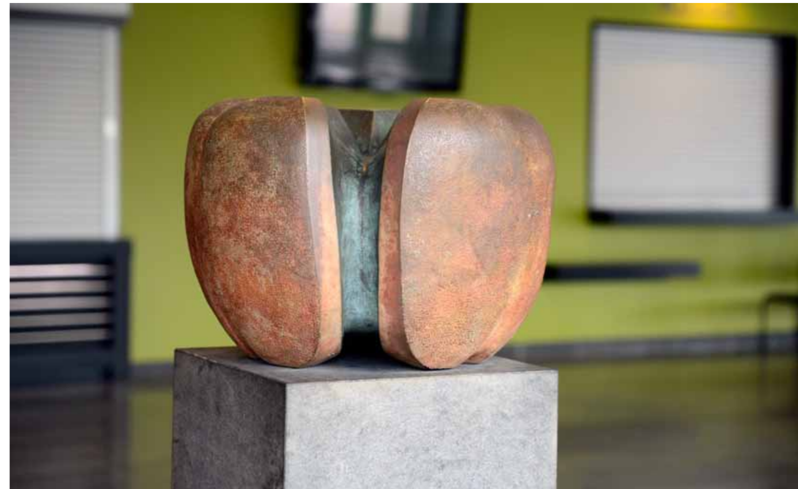
Vitalis i entrén, Arena Skövde