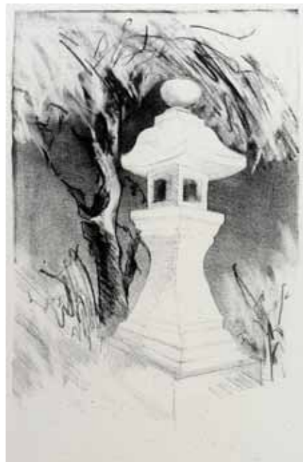
Tempel – Japan, litografi, 1987, 22 x 15 cm