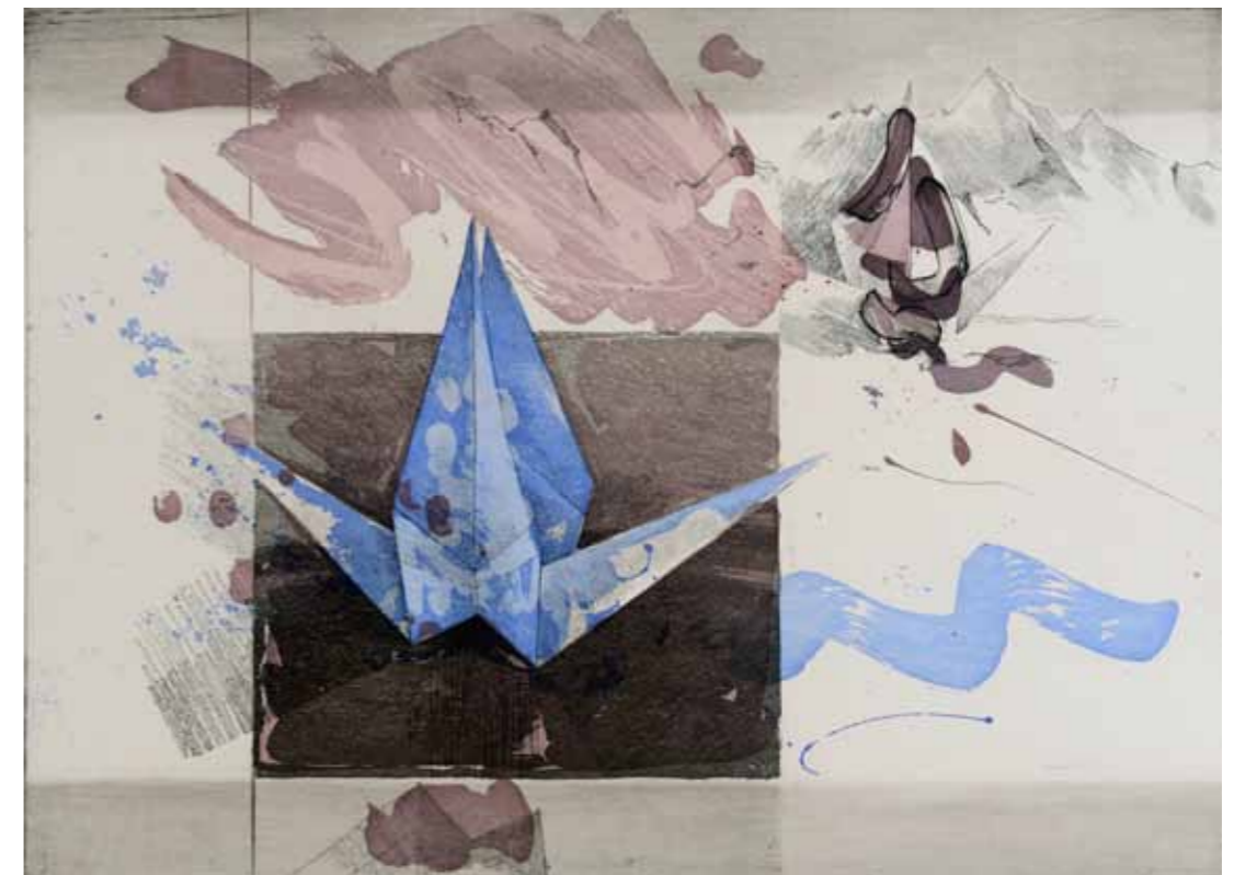
Att vika 1000 tranor II, etsning, 1987, 33 x 45 cm