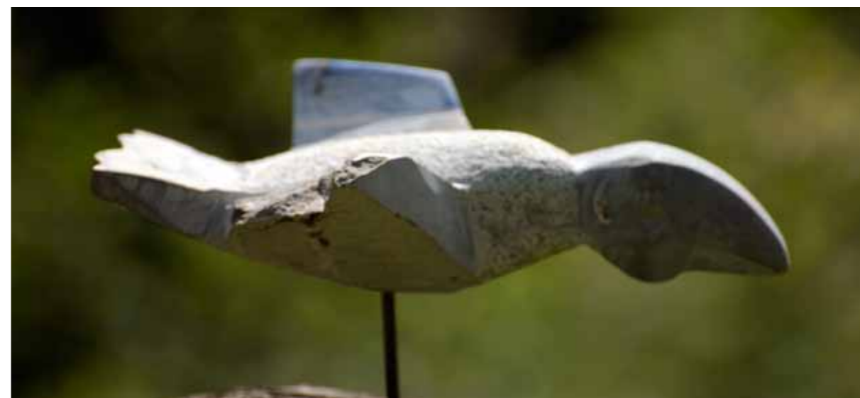
Vendelkråka, kalksten, 2005

verkstad på hemmaplan. Det var en lokal som tillhört "Vägförvaltninga i Skultorp". Där fick han disponera ett skjul med tre väggar och snedtak. Där fanns tillgång till tryckluft. Vinkelslipar, diamantskiva och tryckluftsdrivna mejslar och hammare köpte han in efter hand.