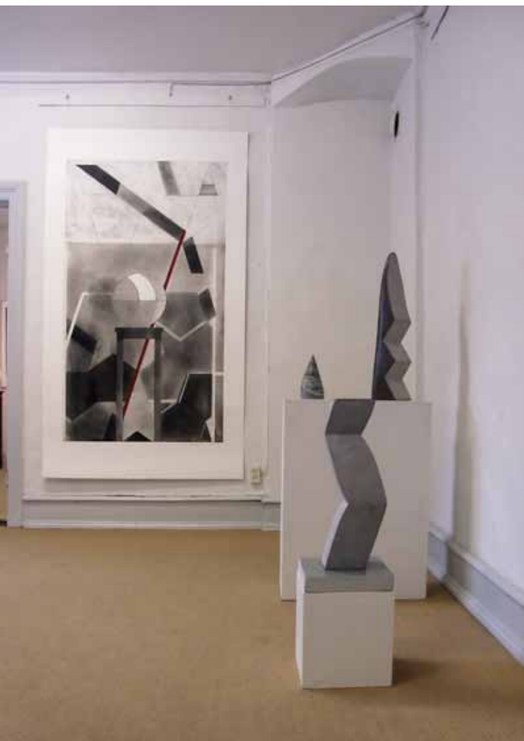
Den stora etsningen da Vincikoden samt tre skulpturer, Galleri Lucifer i Skövde, 2005